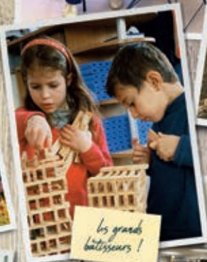
les grands bâtisseurs !