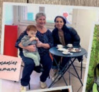
les mamies les mamans