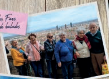
les Fées de balades