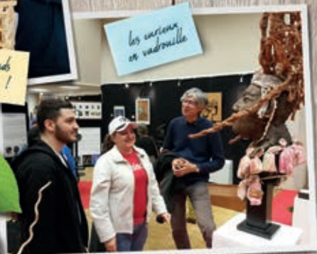
les curieux en vadrouille