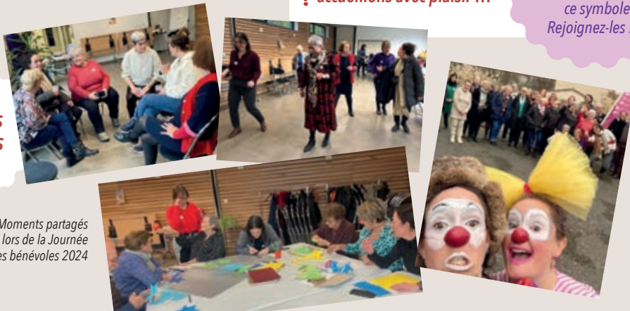
Moments partagés lors de la Journée des bénévoles 2024