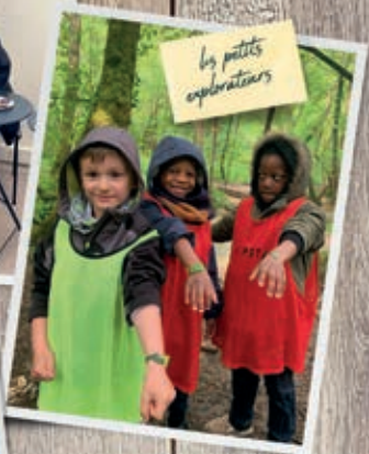
les petits explorateurs